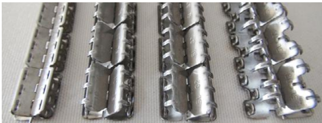
Self-Lock® 00 (Edelstahl)