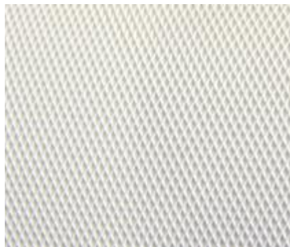
Profil Diamant Top